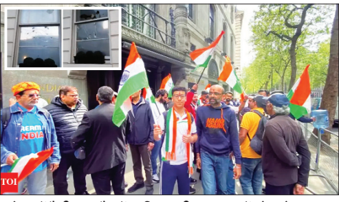
लंदन में रैली। इन्स्टैंट में पाकिस्तानी दूतावास में तोड़फोड़।

लंदन/न्यूरॉक। पहलगाम आतंकी घटना के बाद दुनियाभर में प्रवासी भारतीयों में उबाल है। सोमवार को ब्रिटेन और अमेरिका में कई जगह प्रदर्शन हुए। इनमें ब्रिटेन में लंदन स्थित पाकिस्तानी उच्चायोग की खिड़कियां तोड़ दी गईं। इस पर एक भारतीय मूल के युवक को गिरफ्तार किया गया है। उधर, न्यूरॉक में पाकिस्तान के वाणिज्य दूतावास के बाहर व टाइम्स स्क्वायर पर प्रवासी भारतीय जुटे और भारतीय तिरंगा व बैनर लहराते हुए पाकिस्तान को आतंकी देश घोषित करने की मांग की।