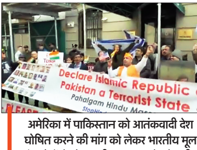
अमेरिका में पाकिस्तान को आतंकी देश घोषित करने की मांग को लेकर भारतीय मूल के लोगों ने अंतरराष्ट्रीय समुदाय से मांग की।