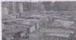
90 से ज्यादा तमख, तख्तों व तख्तारियों की मदद से 1200 घण्टे फिर घरने की तैयार।